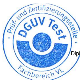
Dipl.-Ing. Frank Fehlauer Zertifizierer

Dieses Zertifikat einschließlich der Berechtigung zur Anbringung des GS-Zeichens ist gültig bis: 12.10.2029 Weiteres über die Gültigkeit, eine Gültigkeitsverlängerung und andere Bedingungen regelt die Prüf- und Zertifizierungsordnung.